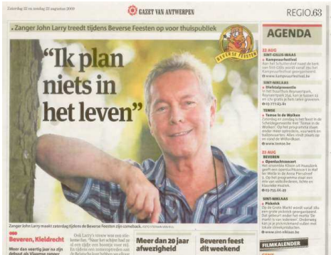
veel plannen hun leven niet