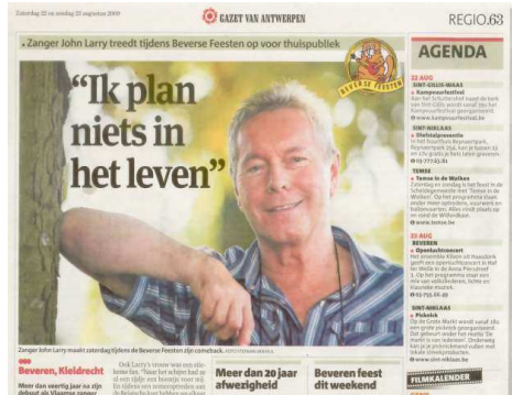
veel plannen hun leven niet laat staan hun levenseinde